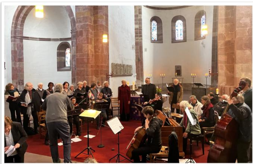
Kantaten-Gottesdienst in Fredelsloh. / Ostermorgen in Oldenrode.