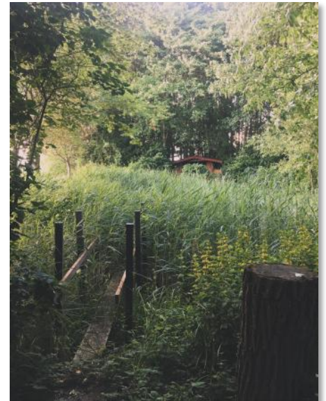
Herzlich willkommen an Theos Teich!