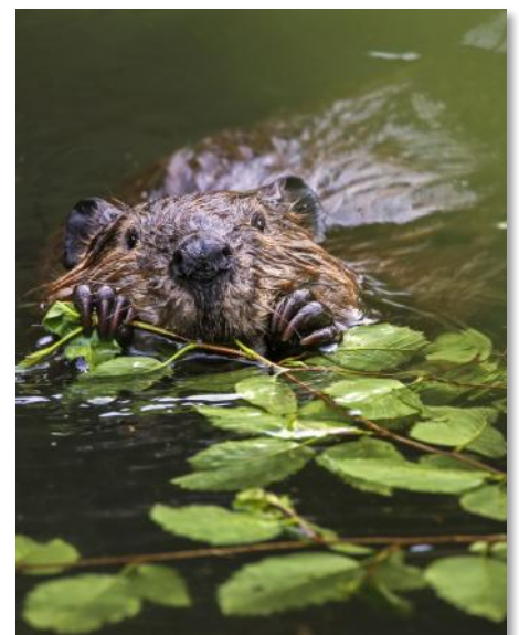
Der Biber ist zurück, sogar an der Moore!