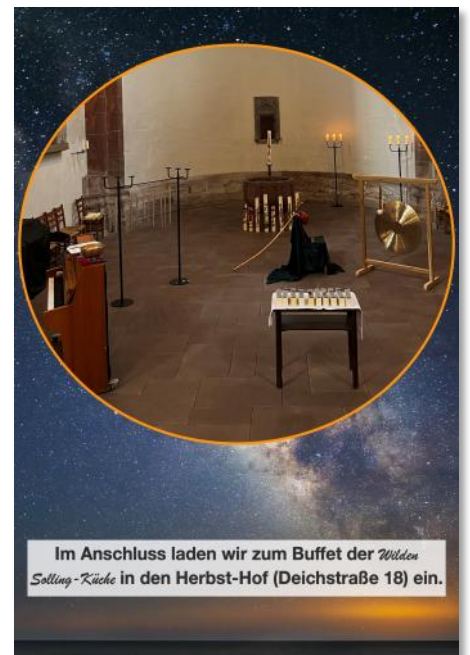
Im Anschluss laden wir zum Buffet der Wilden Solling-Küche in den Herbst-Hof (Deichstraße 18) ein.