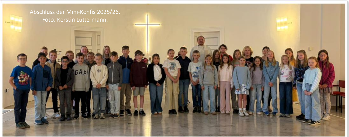
Abschluss der Mini-Konfis 2025/26.

THÜDINGHAUSEN. Am 27. Mai haben sich die Kirchenvorstände der Region Hardeggen-Moringen in Hevensen getroffen und die Erfahrungen mit den Erprobungsräume Hardeggen und Moringen ausgewertet. Im Ergebnis werden wir die Erprobungsräume rechtlich verstetigen, d.h. die Moringen Ortsteile Behrensen, Blankenhagen und Thüdinghausen werden zur Kirchengemeinde Leine-Weper wechseln. Für Thüdinghausen wird darauf geachtet, die inhaltlichen Verbindungen nach Lutterhausen nicht abreißen zu lassen (z.B. der gemeinsame Gemeindenachmittag). Jan Höffker